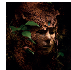
Samuel Chazot, « Masque VII », 2013, bois, papier, écorces, végétaux divers, 42 x 26 x 16 cm.

L'artiste Samuel Chazot exposera ses sculptures dans le parc de l'hôtel Nayme des Oriolles durant ces deux week-ends.