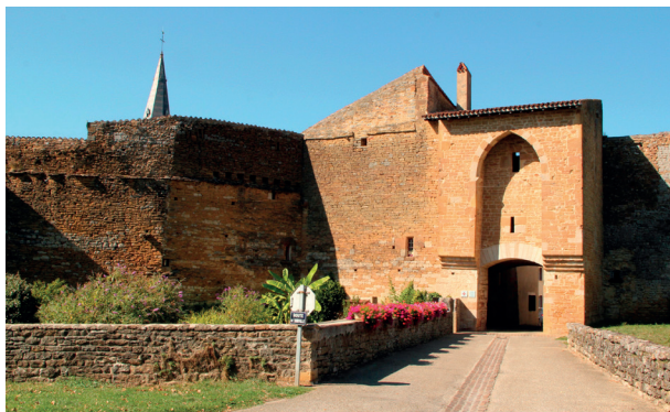
La porte du verger du XII e dans les remparts de Cuiseaux