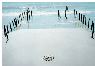
NILS UDO, « Ponte », 1993, photographie, 50 x 70 cm

En lien avec les œuvres de NILS UDO, artiste plasticien allemand et l'un des pionniers du « Land art », les publics associés sont invités à créer des œuvres sur le thème « Art et Nature ». Toutes les œuvres réalisées seront exposées durant l'Inter Biennale. Y participent plus de mille personnes : scolaires de la maternelle au lycée, jeunes de Pôle Emploi, personnes âgées des EHPAD ou résidences seniors, personnes en situation de handicap et de nombreux groupes d'artistes amateurs qui se sont créés à cette occasion.