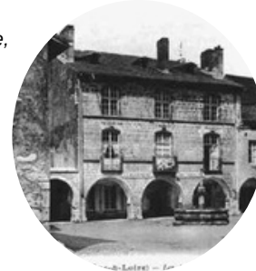
La place Puvis de Chavannes

Cuiseaux, ancienne cité médiévale, est inscrite à l'inventaire des sites pittoresques de Saône-et-Loire.