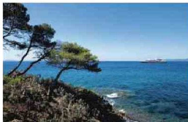
La baie du Rayol, au pied de la corniche des Maures, dans le Var.

Très attaché à la Normandie où il a grandi, Gérard Fromanger, figure de Mai 68 et représentant du courant de la Figuration narrative, retourne à Caen à l'occasion de l'exposition que le musée des Beaux-Arts lui consacre, jusqu'au 3 janvier 2021. On y retrouve son travail coloré et pop qui conjugue souvent peinture et photographie. mba.caen.fr