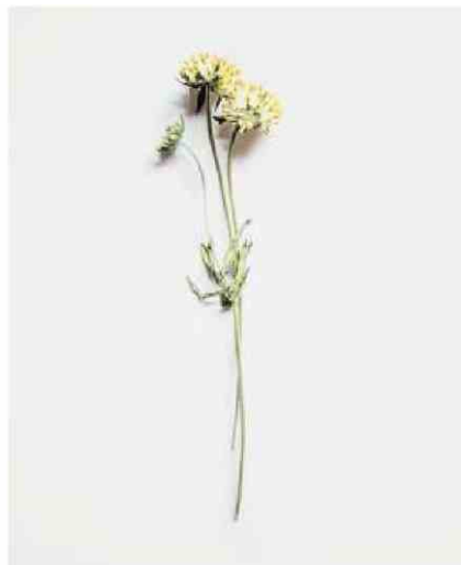
Anthyllis vulneraria , plante connue pour ses propriétés cicatrisantes.

À la Goutte d'Or, le nouveau temple dédié à la musique reprend du service à partir de ce week-end. Le 360 Paris Music Factory,