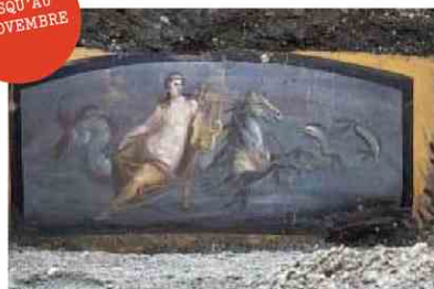
Fresque du comptoir d'un thermopole (débit de boissons), I er siècle après J.-C.