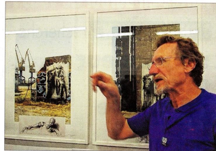
Jean Genet, à Brest en 2006 : « En collant cette composition sur les murs des docks de Brest, Ernest Pignon-Ernest s'appuie sur le choc des esthétiques, l'irruption dans un univers de poutrelles métalliques, de grues, de containers en écho à Querelle de Brest, roman de J. Genet, publié en 1947. »